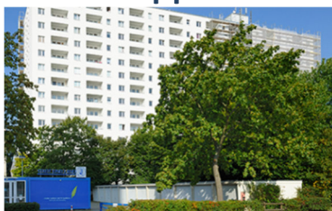
Модернизированный жилой дом 2021-22гг. в г. Берлин